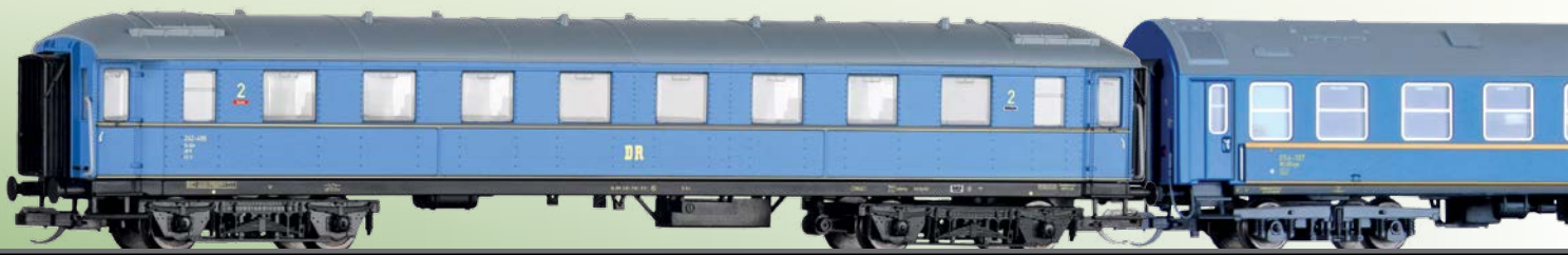
Abb. 8: Liegewagen und Schlafwagen-Set (Teil 1) des "Tourex" der DR.