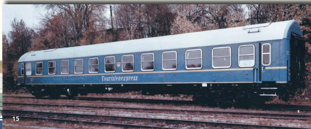
Abb. 15: "Tourex"-Schlafwagen "FDJ" (Foto: TILLIG-Werksarchiv).